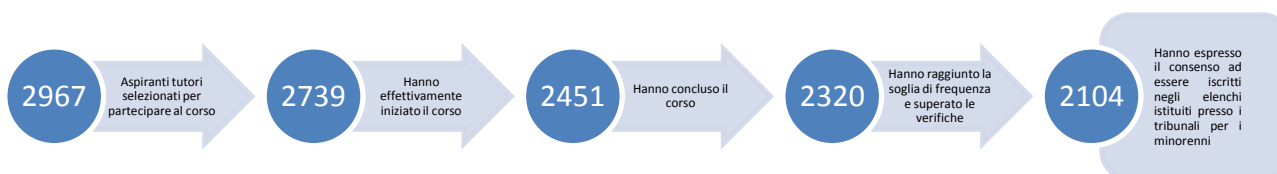
Figura 3 - Numero degli aspiranti tutori volontari selezionati per partecipare al corso, che lo hanno iniziato e concluso con successo e che hanno espresso il consenso a essere iscritti negli elenchi istituiti presso i tribunali per i minorenni. Valori assoluti e percentuali

Alla data del 30 giugno 2019 sono stati realizzati complessivamente 70 corsi di formazione. Gli aspiranti tutori volontari selezionati sono stati 2967. Hanno iniziato il corso 2739 persone, il 10,5% non ha concluso il corso e il 4,8% lo ha concluso ma non lo ha superato. Infine, tra le persone risultate idonee a essere iscritte negli elenchi dei tribunali per i minorenni, solo il 9,3% non ha espresso il consenso all'inserimento.